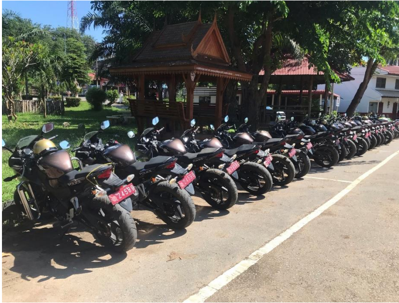
ภาพแสดงการตรวจครุภัณฑ์ ยานพาหนะประจำปีงบประมาณ ๒๕๖๗