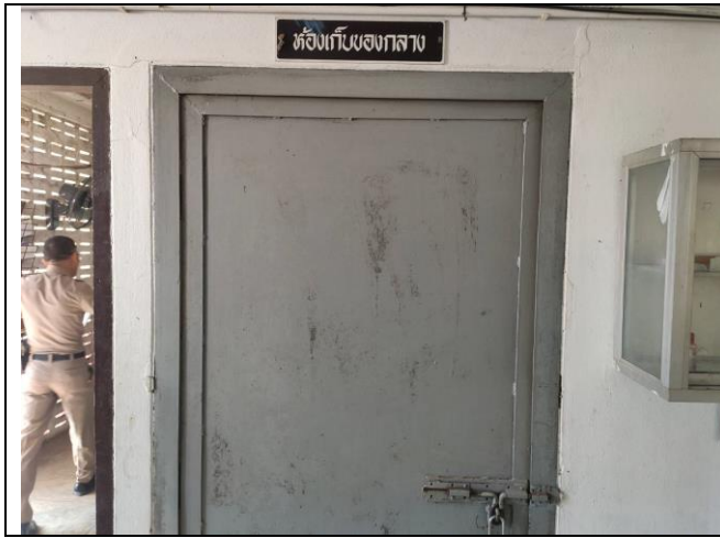
ภาพห้องเก็บของกลาง