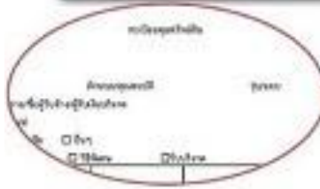
ตัวอย่างทะเบียนคุมทรัพย์สิน

ศาสตราภัณฑ์ - ลงทะเบียนคุมทรัพย์สินตามแบบที่ กวพ.กำหนด - ลงข้อมูลในระบบ POLIS