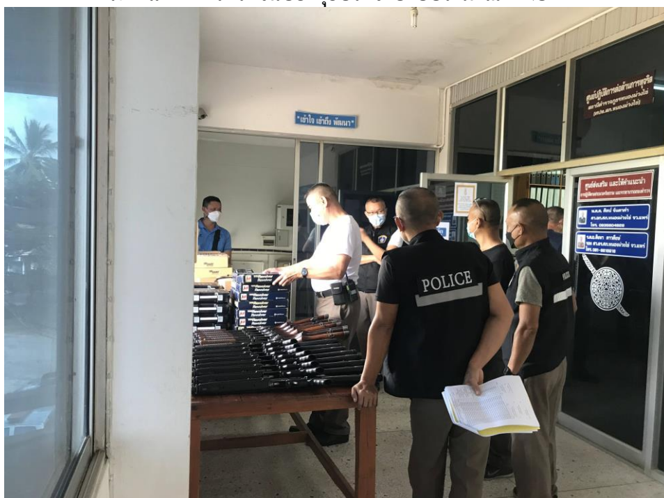
ภาพแสดงการตรวจจับอาวุธประจำปิงประมาณ ๒๕๖๗