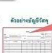
ตัวอย่างบัญชีวัสดุ